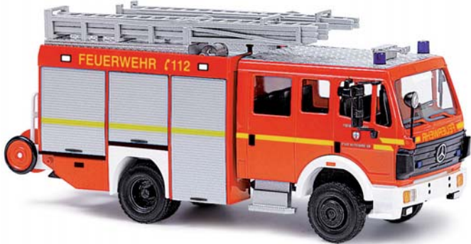
43803 Mercedes-Benz MK 94 1224 Löschgruppenfahrzeug »FW Kaltenkirchen«