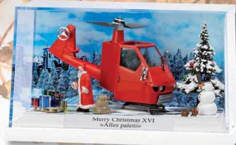
7619 Kleindiorama Merry Christmas XVI »Alles Paletti«