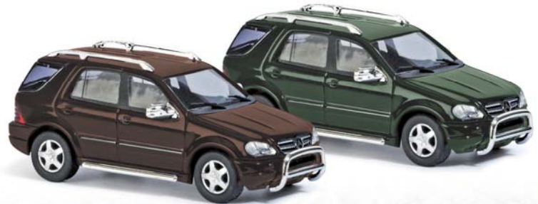
48571 Mercedes-Benz M-Klasse ML55 AMG »Offroad«, sortiert in 2 Farben