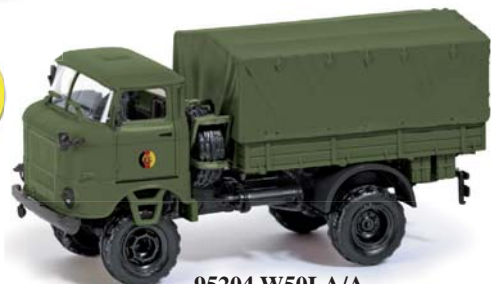
95204 W50LA/A »NVA« ESPEWE Modelle