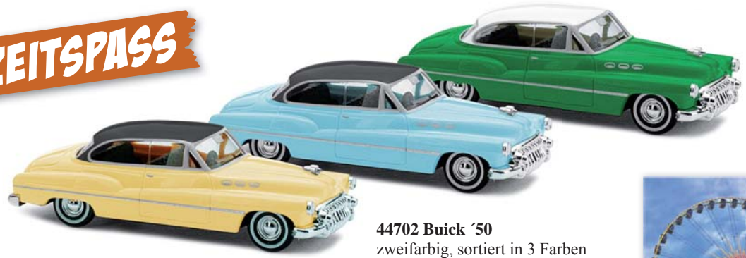
44702 Buick '50 zweifarbige, sortiert in 3 Farben