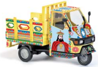
48481 Piaggio Ape 50 »Sizilien«