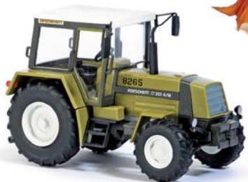
50406 Traktor Fortschritt ZT 323-A/M »Melioration«