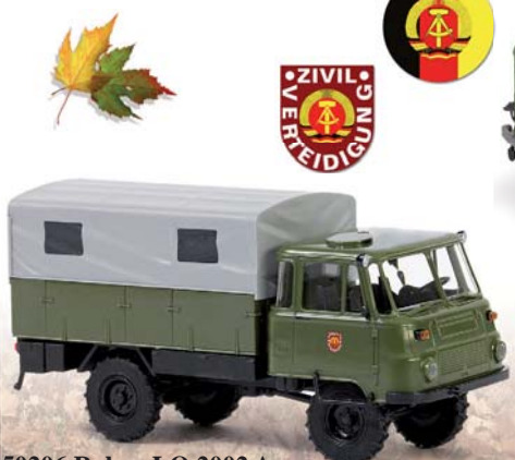
50206 Robur LO 2002 A »Zivilverteidigung«