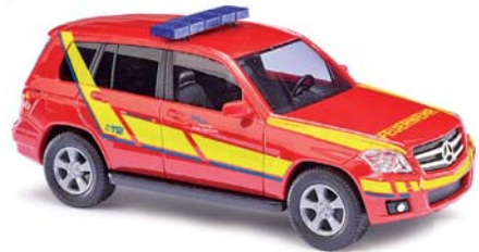
49764 Mercedes-Benz GLK-Klasse »Freiwillige Feuerwehr«