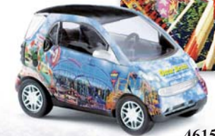
46157 Smart Fortwo Puzzlesmart »funfair«