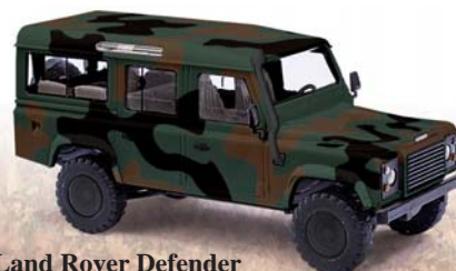
50304 Land Rover Defender mit Tarnflecken

Ein Modell, zwei Ausgaben! Jagdflugzeug 25010 ist in Original-Bemalung, wie es von Unteroffizier Oswald Fischer 1942 geflogen wurde. 25011 ist die »umbemalte« Ausgabe des gleichen Fliegers, da er nach einer Notlandung im britischen Eastbourne erbeutet wurde. Einige Details und Kennzeichnungen blieben jedoch bestehen, wie beispielsweise die weiße Nr. 11.