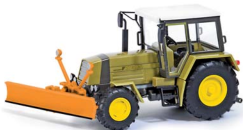
95009 Traktor Fortschritt ZT 323 mit Schneepflug (LSR) ESPEWE Modelle