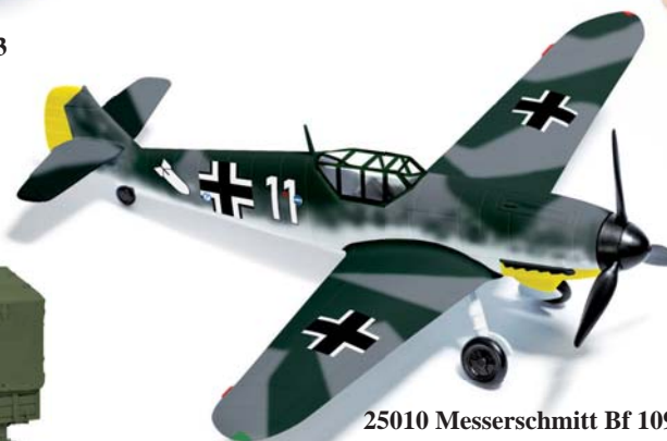
25010 Messerschmitt Bf 109 F4 »Oswald Fischer«