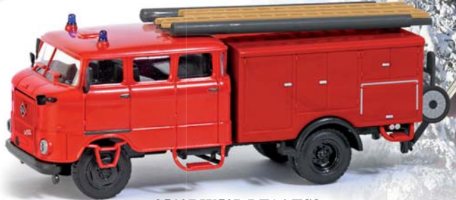
95107 W50L LF16-TS8 »Rot« ESPEWE Modelle