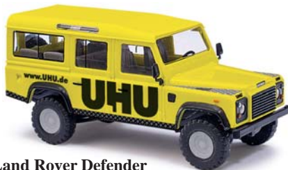
50306 Land Rover Defender »UHU«