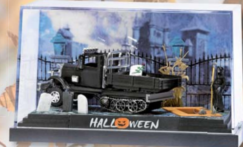
7620 Kleindiorama Halloween 11 »Verdorbene Erde«