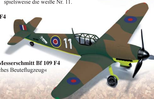
25011 Messerschmitt Bf 109 F4 »Britisches Beuteflugzeug«