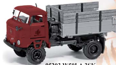
95203 W50LA 3SK mit hoher Bordwand »Ziegelei« ESPEWE Modelle