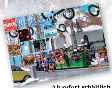
Ab sofort erhältlich Prospekt Modellwelten Herbst/Winter 2012