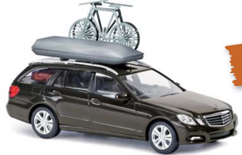
44262 Mercedes-Benz E-Klasse T-Modell mit Dachbox, Fahrrädern und Koffern in Innern