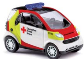
46152 Smart Fortwo Coupé »DRK«